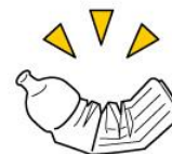
일러스트 : 경제산업성 웹사이트 발취